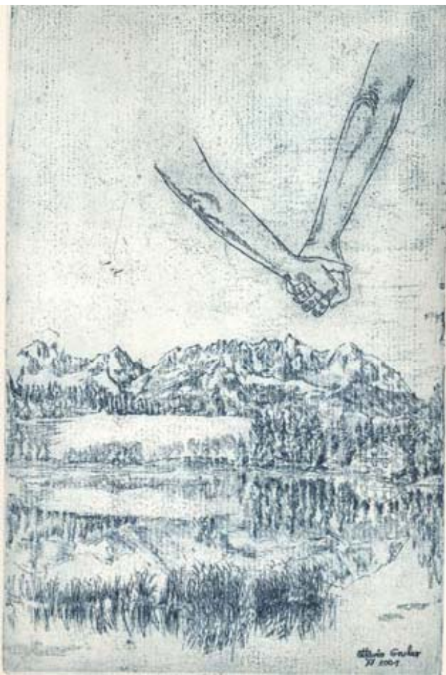
Incisione di Ottavio Gruber

Amico dammi la mano. Vedo sorridere l'aria al nostro passaggio e indietreggiando per darci la strada le ombre del sole.