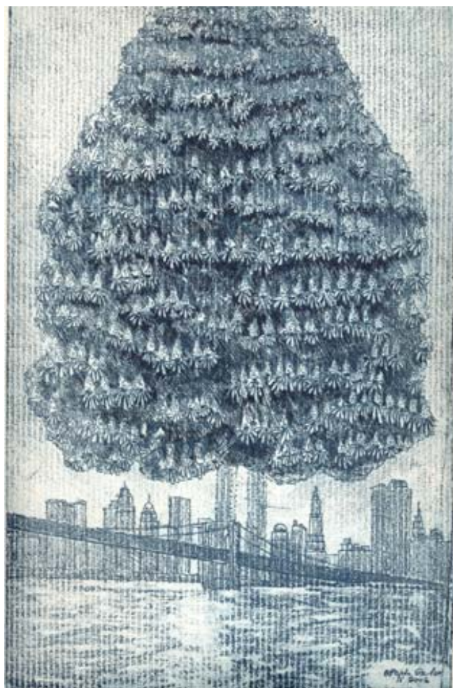
New York 2001 (Incisione di Ottavio Gruber)