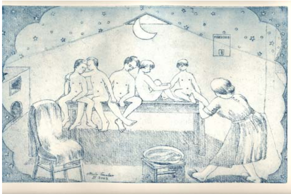
Incisione di Ottavio Gruber

Deso, che te son diventà ti picia, sentada su la carega, te lavemo noi pregando che i to oci pieni de sono i resti sempre verti