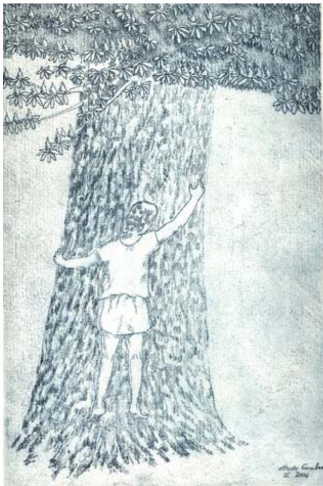
Incisione di Ottavio Gruber

Quando giungerò al di là della riva vorrei trovare un bianco palazzo col profumo del giglio e lo splendore del cielo trasformati in terra e mura e spazio racchiuso che accolga il mio viaggio e il mito antico del mare divenuto silenzio nella mia bocca. Vorrei trovare la pace dei campi, la vita dei fiori e un albero grande per andare in alto e toccare con mani nude il tempo. Vorrei trovare la gioia danzare fra la gente che non mi conobbe.