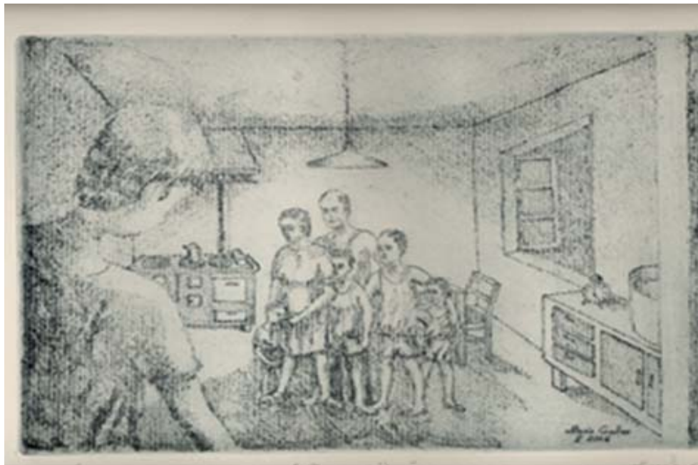
Incisione di Ottavio Gruber