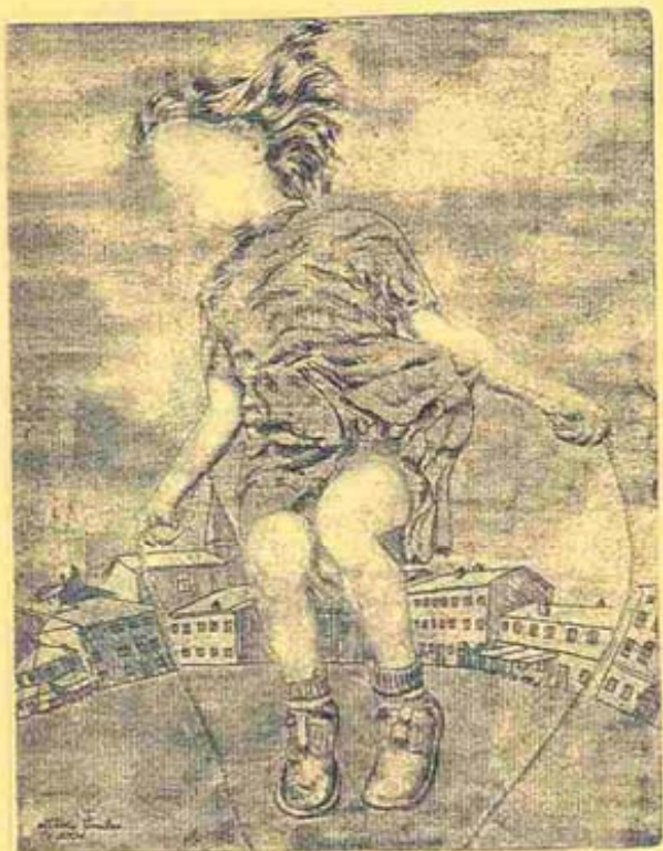
Incisione di Ottavio Gruber